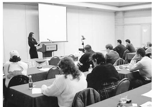
L'animateur guide l'interview en lisant le questionnaire, ainsi que les concepts présentés.