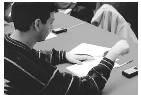
Chaque interviewé utilise les boîtiers RAPID RESPONSE pour répondre à toutes les questions.